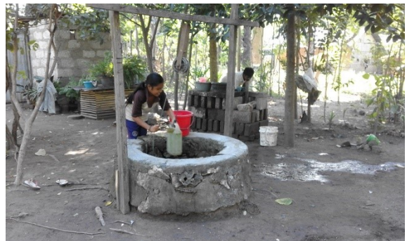
zomaar wat mooie plaatjes van het mooie Sumba