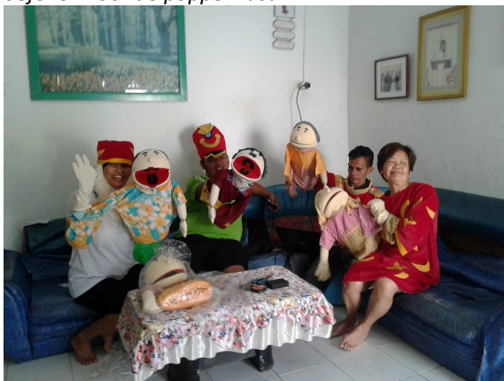
oefenen voor de poppenkast