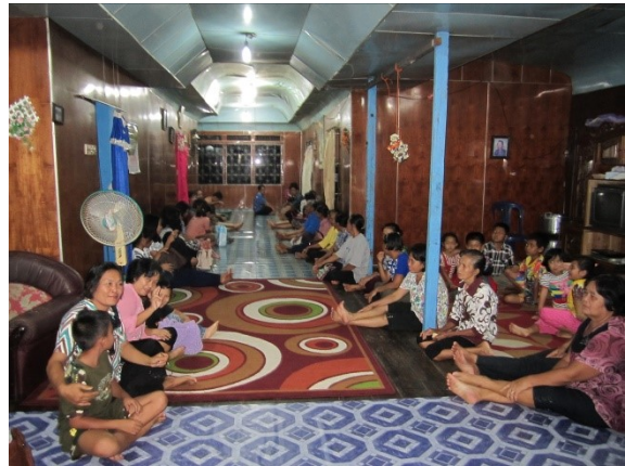
kerkdienst bij een gezin aan huis