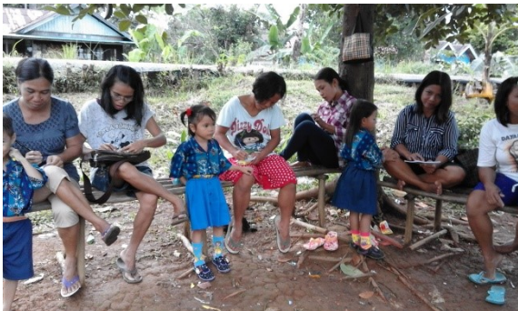
moeders schrijven hun gebeden op na de cursus