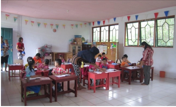
de nieuwe klas van kleuterschool KPI1