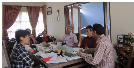
bestuursvergadering Kota Palem Indonesia