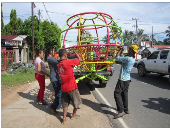
een speeltoestel kopen en vervoeren. meteen na het plaatsen wordt het getest