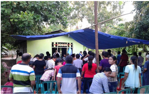
impressie opwekkingsdiensten en trainingen op Sumba