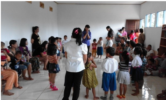
de nieuwe klas van kleuterschool KPI2