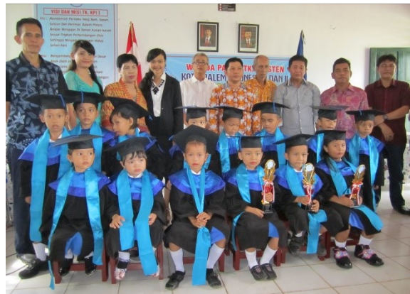
het 'afstudeerfeest' met kinderen en genodigden