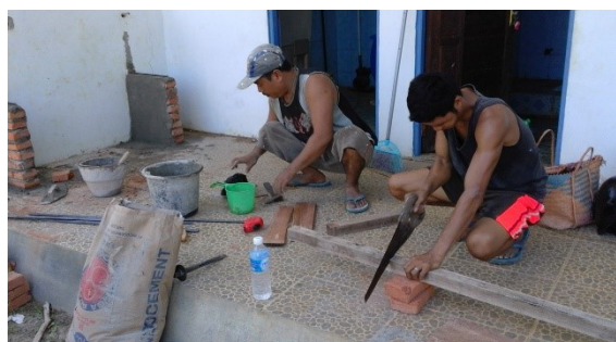
klussen bij kleuterschool KPI2