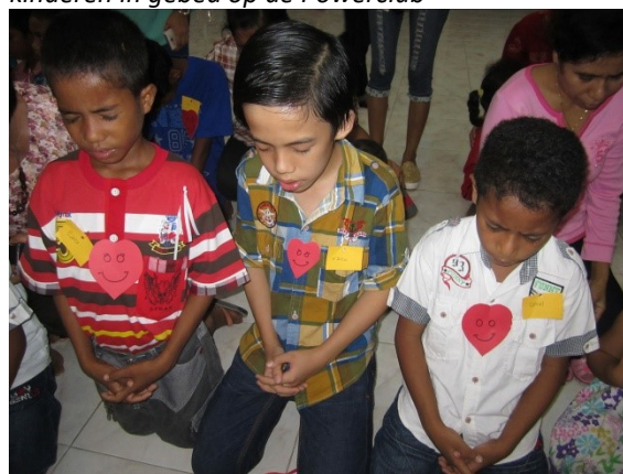
kinderen in gebed op de Powerclub