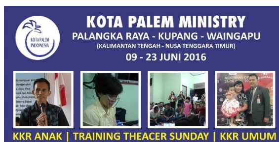
het spandoek van de evangelisatiereis