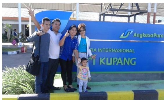
het team van Kota Palem Indonesia Ministry